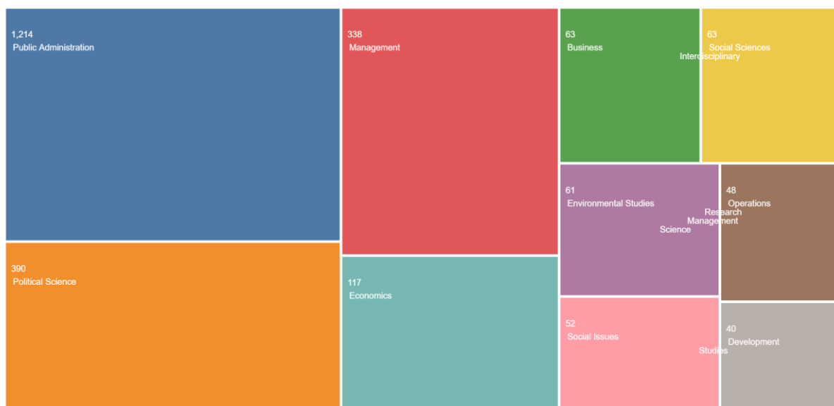
Gráfico 2. Publicações em “ public policy ” por área/categorias

No universo dos 1.505 artigos sobre o tema “ public policy ”, estabelecendo como parâmetro os principais resultados os últimos 25 anos, têm-se que de 2004 a 2015 o número de publicações varia entre 19 e 65 por ano (ver Gráfico 1). 2016 apresenta 74, 2017 86, 2018 80, 2020 109 e, o ano com mais publicações, 2019 110 produções. Até o mês de setembro de 2021 foram registrados 74 artigos publicados sobre esse tema.